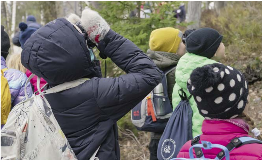
KUVA: JARI KOSTET

Läs mera på: www.haltia.com/sv/naturskola/