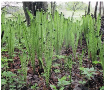
KUVA: VANTAAN LUONTOKOULU

Vantaan luontokoulu järjestää tilauskursseina myös esim. koko päiväkodin tai koulun luontoaiheisia koulutuksia. Kurssien sisältöt ovat monialaisia, menetelmät toiminnallisia ja niiltä saa käytännön apua opetussuunnitelman toteuttamiseen. Aiheena voi olla vaikkapa lähiluonnon monimuotoisuus tai luonto oppimisympäristönä, mutta osallistujat voivat myös esittää toiveita kurssien aiheista tai painotuksista. Kysy rohkeasti lisää toimisto@vantaanluontokoulu.fi tai p: 050 430 9300.